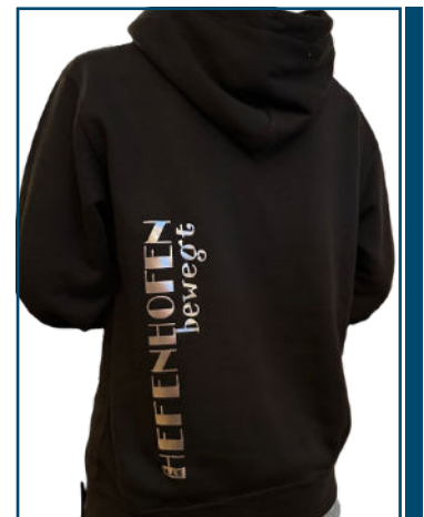
Unsere neuen Hoodies

Fr. 24.05.2024 - Dä schnällscht Hefehofer & Hefenhofer Dorflauf!