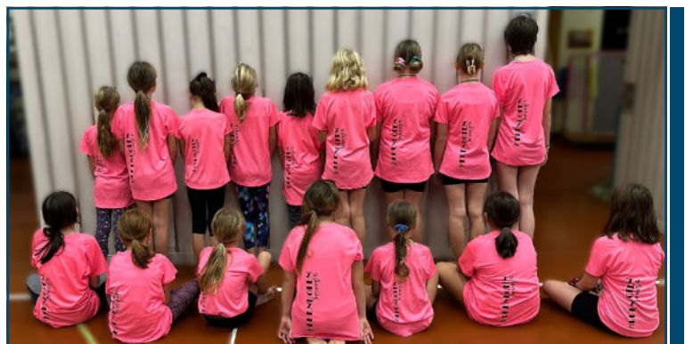
Mit den neuen pinken Shirts